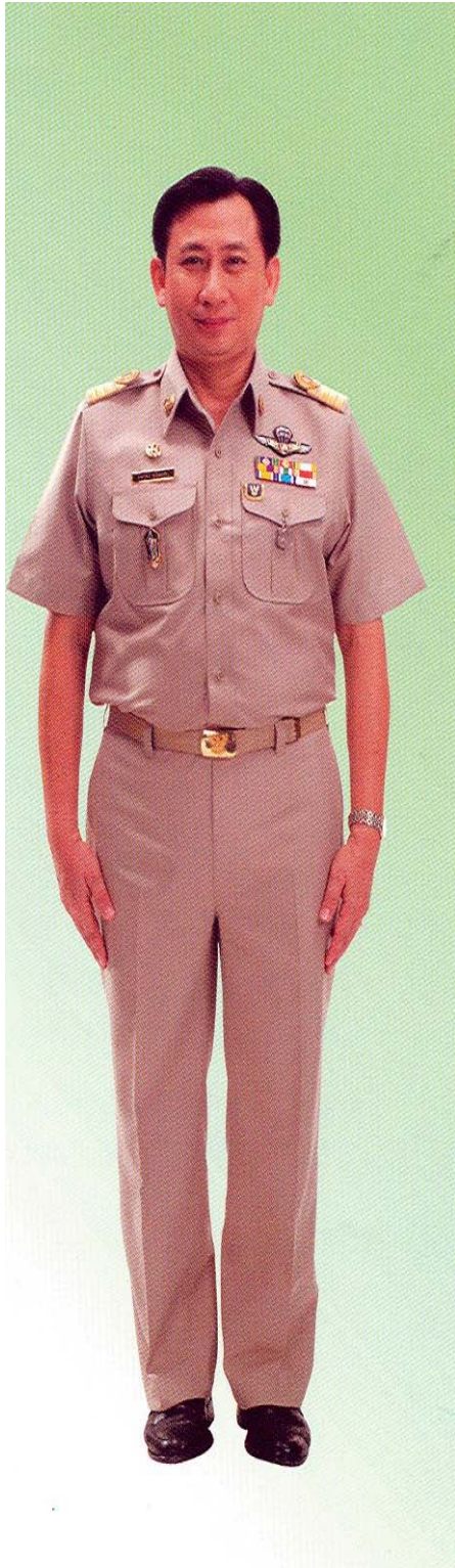
เครื่องแบบสีกากี คอพับแขนสั้น ชาย