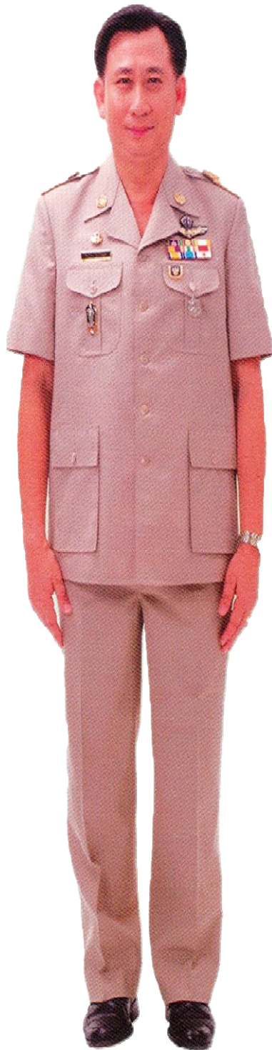
เครื่องแบบสีทากี คอแบะแขนสั้น ชาย