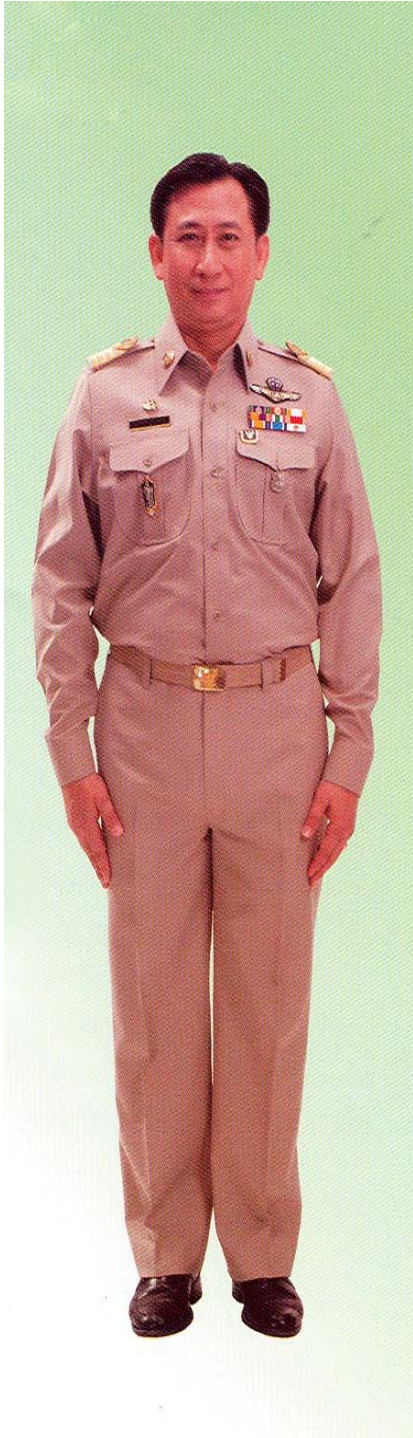
เครื่องแบบสีกากี คอพับแขนยาว ชาย